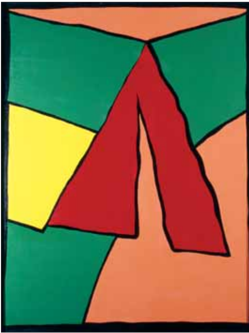
"Hommage à Jean Arp", 1972, 97 x 73