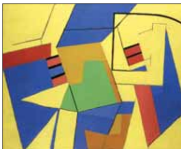
"Sans Titre", 1952, 46 x 55