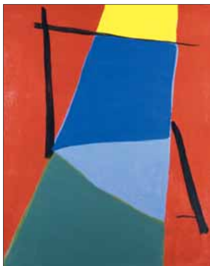
"Margaux", 1971, 73 x 60