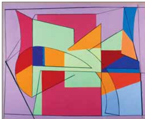
"2003", 1958, 60 x 73