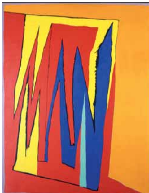
"Avignon I", 1954, 92 x 73