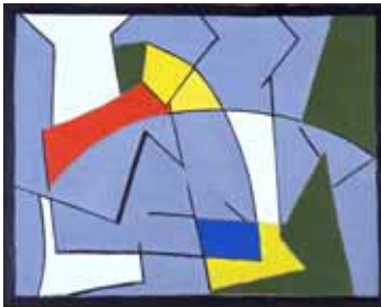
"Sans Titre", 1958, 33 x 41,5