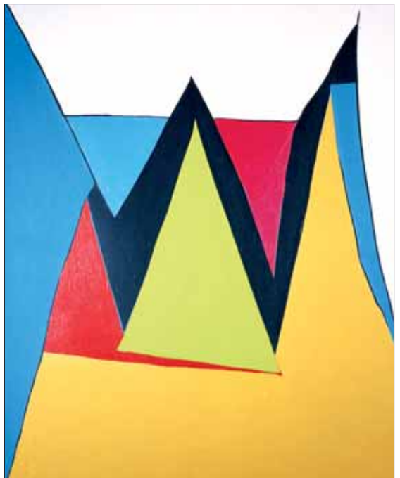
"Opus 7 Svogerslev", 1978, 100 x 81