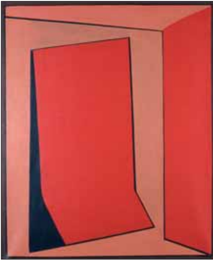
"Vire", 1955, 73 x 60