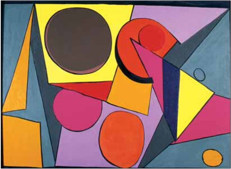
"Ajaccio Midi", 1969, 97 x 130