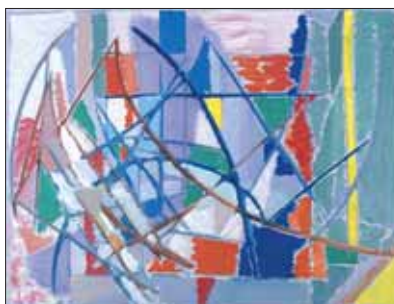
"Opus 3 Solsidan", 1948, 46 x 61