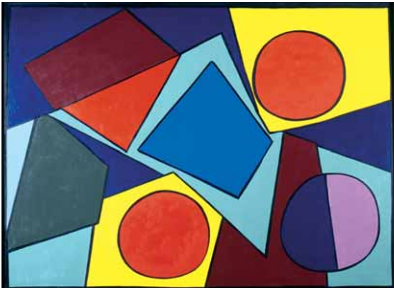
"Ajaccio Matin", 1969, 97 x 130