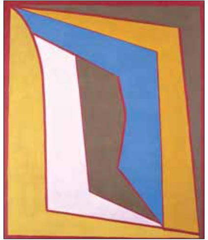
"Sans Titre", 1958, 67 x 56