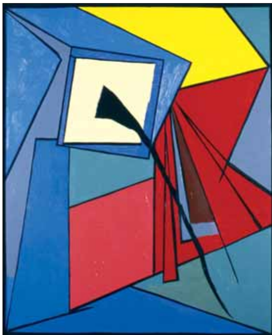
"Hommage à Stuff Smith", 1968, 100 x 81