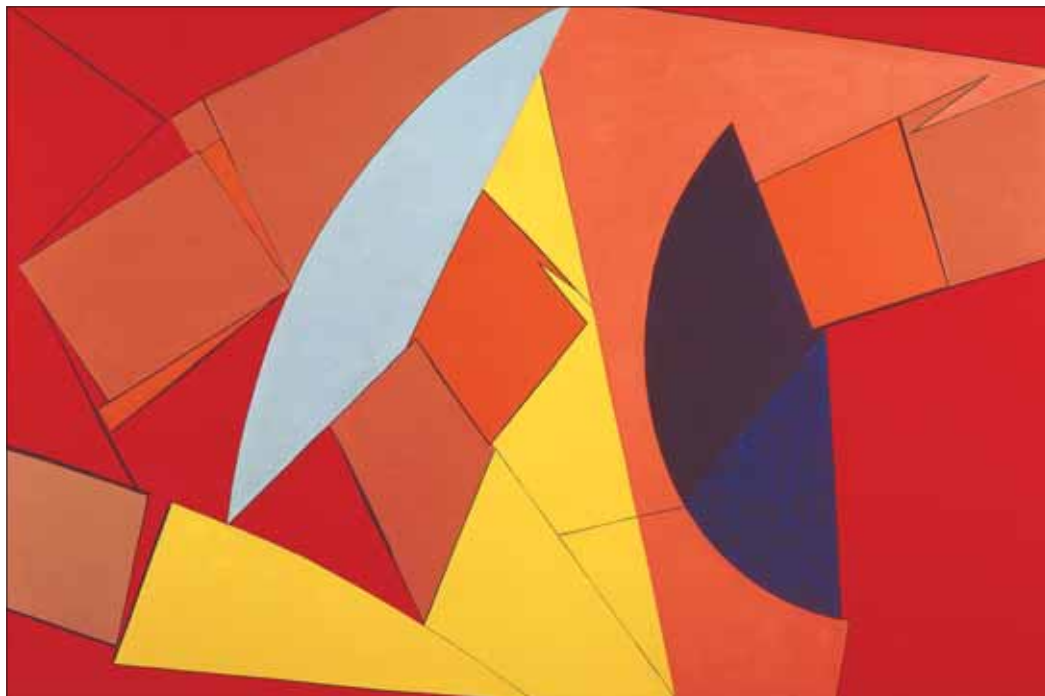
"Ghisoni", 1960, 130 x 195