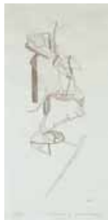
"The Bride", 1965, etsning, 30 ex, 27 X 12 cm, (623c)