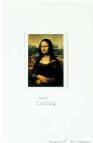
"L.H.O.O.Q. Shaved", 1965, readymade: reproduktion, 8,8 X 6,2 cm, (615)