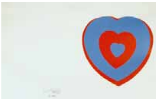
"Coeurs Volants", 1961, serigrafi, 32,4 X 51 cm, 125 ex, (446c)