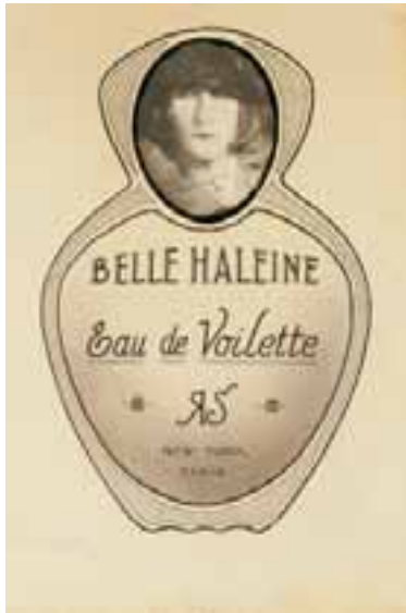
"Belle Haleine: Eau de Voilette", 1921, collage, 29,6 X 20 cm (gjord tillsammans med Man Ray), (386)