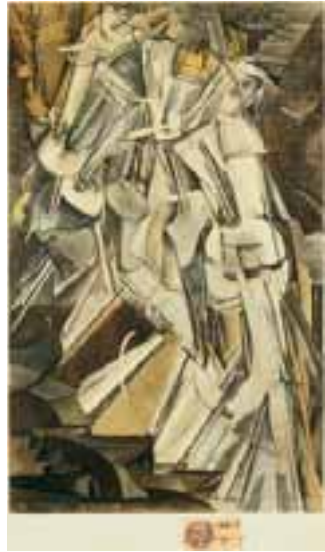
"Nude Descending a Staircase No 2", 1937, pochoirfärgad reproduktion, 35 X 20 cm, (458)