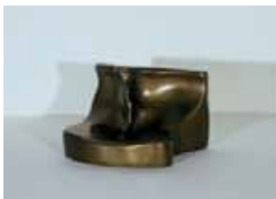
"Feuille de Vigne Femelle", 1961, brons, upplaga: 10, 9 X 14 X 12,5 cm, (536c)