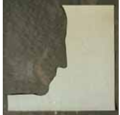
"Self-Portrait in Profile", 1963, collage, 14,9 X 14,9 cm, 25 ex, (557b)