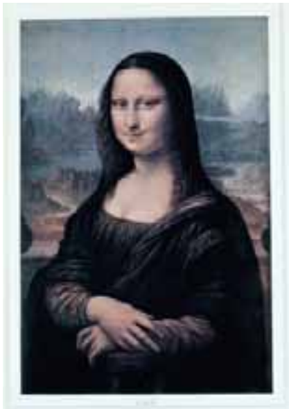
"L.H.O.O.Q.", 1964, blyerts på reproduktion, 35 ex., 30,1 X 23 cm, (369f)