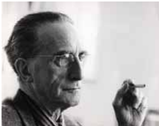
"Marcel Duchamp", 1961 på Moderna Museet Stockholm, foto: Lütfi Özkök, 17 X 22,5 cm (ej tidigare publicerad)