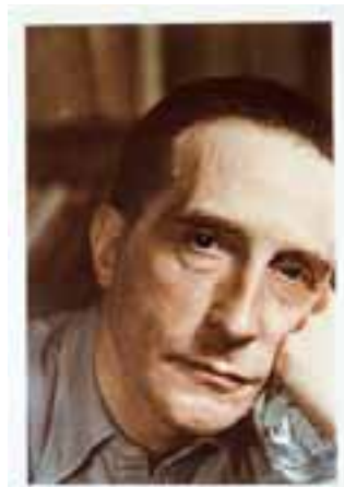
"Marcel Duchamp", 29,7 X 19,7 cm