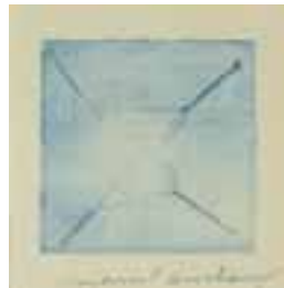
"Tiré à 4 Epingles", 1959, etsning, 11,5 X 11,5 cm, (575)