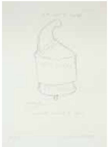
"Pulled at Four Pins", 1964, etsning, 100 ex, 32 X 22,8 cm, (609a)