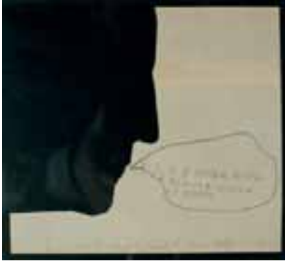
"Self-Portrait in Profile", 1963, collage, 14,9 X 14,9 cm, dedicerad till CFR, (557b)