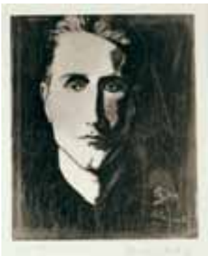
"Marcel Duchamp", 1971, etsning av Man Ray, akvatintetsning, 18,5 X 15 cm, 125 ex